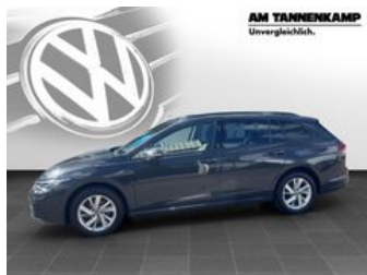
AM TANNENKAMP Unvergleichlich.