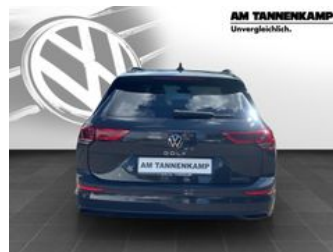
AM TANNENKAMP Unvergleichlich.