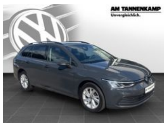
AM TANNENKAMP Unvergleichlich.