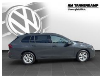
AM TANNENKAMP Unvergleichlich.