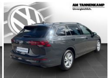
AM TANNENKAMP Unvergleichlich.