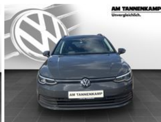
AM TANNENKAMP Unvergleichlich.